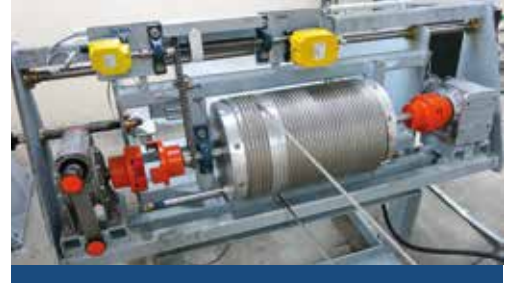
Seilwinde für motorische Hissvorrichtung