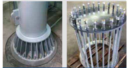
Mastfuß mit Ringsteife