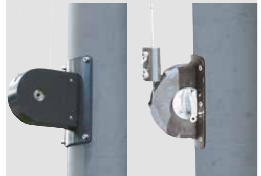
Kurbelhissvorrichtung mit Hissseil aus Edelstahl